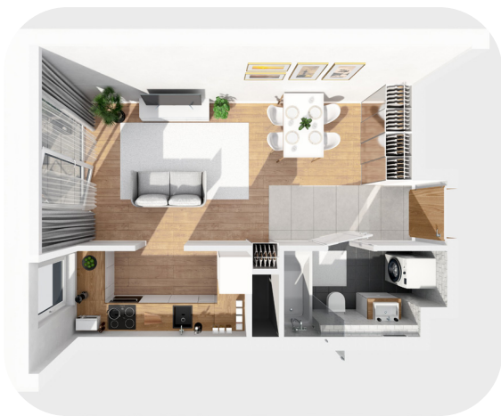
Mieszkania dwupokojowe 38m 2 – 49m 2